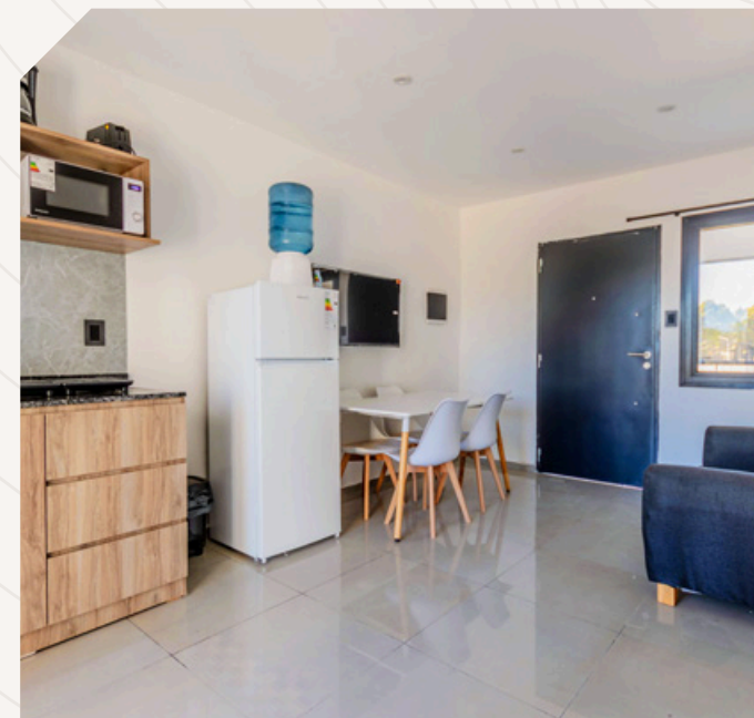
3 ambientes + cochera